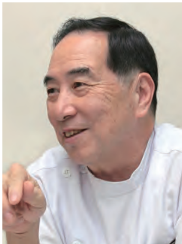
湘南記念病院 院長