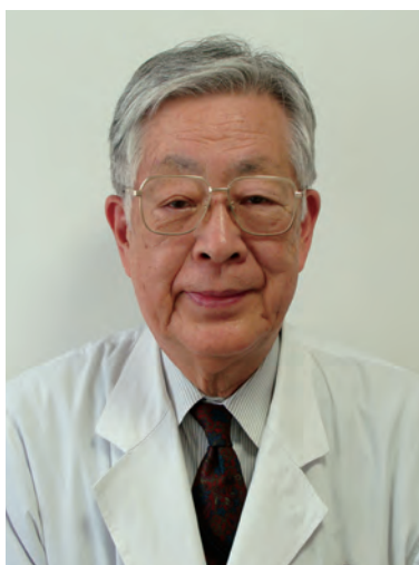
湘南記念鎌倉クリニック 院長